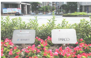
【天神交差点パルコ前花壇】

まちにさらなる賑わいを創出し回遊性を高めることを目的として花壇のスポンサーになって頂く企業・団体の募集が始まっています！