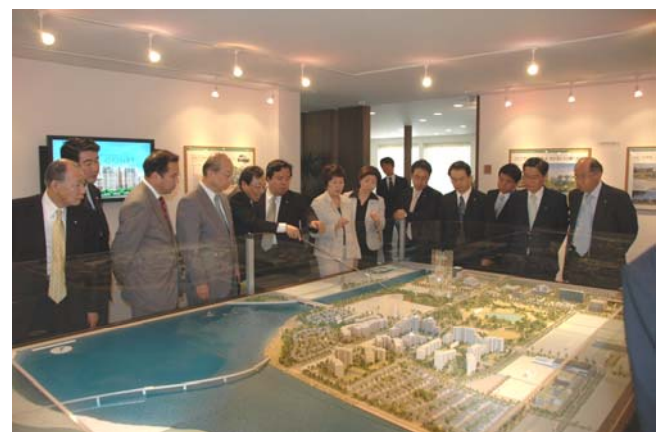
事業完成予想図の説明を受けました。

サイバー大学 事務局入試係 〒105-7311 東京都港区東新橋 1-9-1 東京汐留ビルディング 電話：0120-948-318 (受付：10：00～19：00 土日祝日除く)