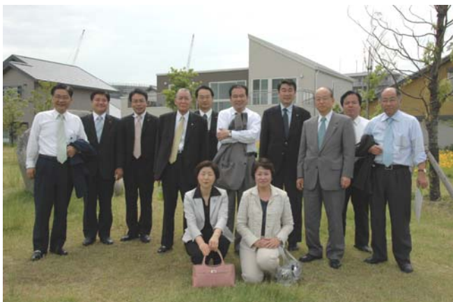
生垣で囲まれた閑静な住宅地となっています。