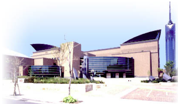
福岡市総合図書館の外観

福岡市総合図書館について、利用が不便な地域に住む住民の利便性を向上し、利用者増加を図るために、郵便による圖書の貸し出しサービスを行なえないのか質問しました。