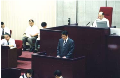
9月22日 本会議場にて撮影

支出すなわち医療費が毎年増加している現状を踏まえ、病院の診療費の適正化と、地域での健康づくり活動や、介護予防事業の充実等により、医療費の適正化を図る必要があると提言し、健康診断について節目検診（40歳・50歳など）対象者